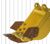
Schaufel 200 mm