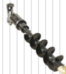
Erdbohrer mit Bohrer FI 20 /90